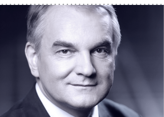
Waldemar Pawlak, wicepremier, minister gospodarki