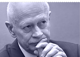
Michał Boni, minister administracji i cyfryzacji